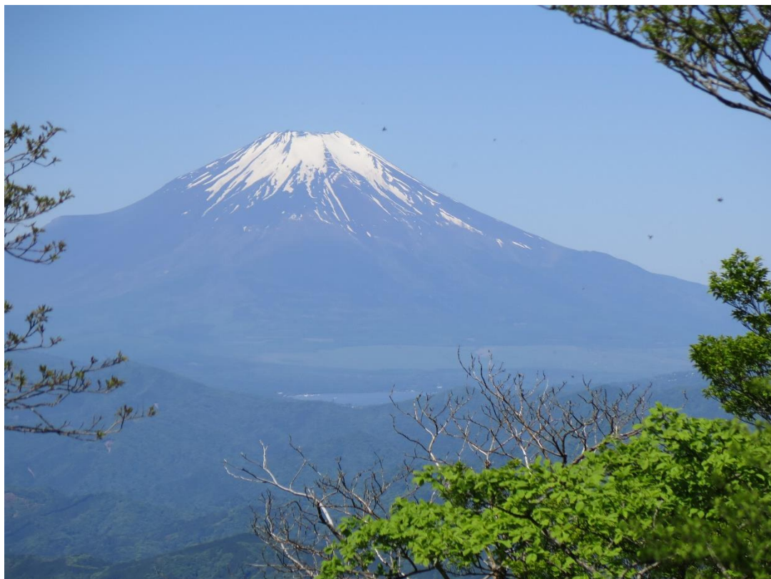
檜洞丸山頂から富士山