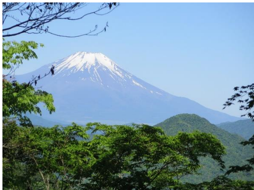
展望台から富士山

つつじ新道上部まで登ると白ヤシオつつじの花が道にいっぱい落ちている。上を見上げると青空をバックに盛りを過ぎた白ヤシオが見える。林の中にアカヤシオも咲いているが数が少ない。