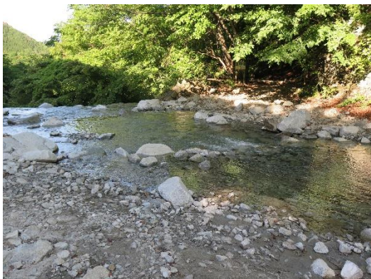
ゴーラ沢出合は水量が多かった

通常ルートつつじ新道を登る。足が重いのでゆっくりしたペースで歩く。ゴーラ沢出合に出ると沢の水量が多い。ドボンしないよう慎重に渡る。展望台に向う途中のベンチで小休止。子供達を連れた7～8人のパーティが休んでいて賑やかだ。水分補給