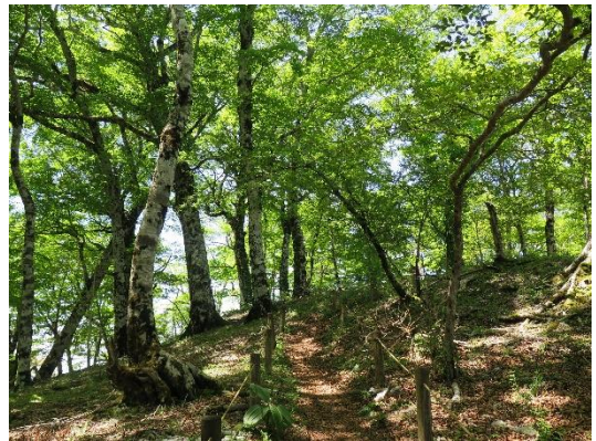
ブナ林の中を歩く