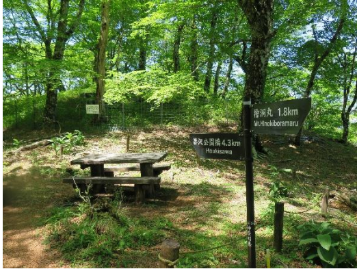
何時ものベンチでランチタイム

1ピッチほど歩いていつも昼食をとるベンチに到着。今年もやって来たよとベンチに座り、昼食にする。時折登山者が通るが、ブナ林の新緑と静けさに癒される。