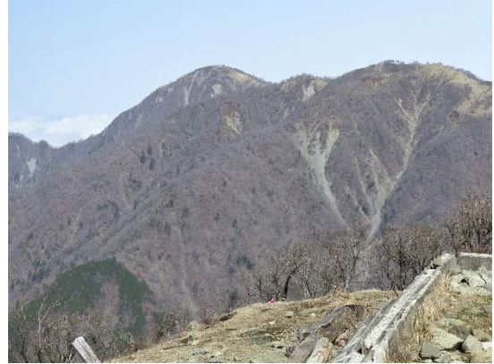
塔ノ岳から蛭ヶ岳

《参考データ》 歩行距離;16.5km 累積標高;上り:1620m/下り:1611m