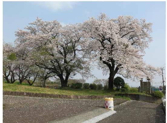
大倉バス停前の桜は満開だった