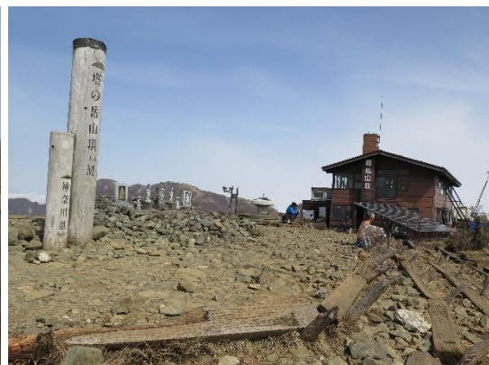
塔ノ岳山頂は静かだった

前日からの黄砂の影響か霞がかかり塔ノ岳山頂の眺望は良くなかった。富士山もうっすらと見えるだけだった。