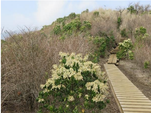
表尾根縦走路脇に馬酔木が咲いていた

今回も足が攣ることもなく歩く事が出来たが、加齢による足の衰え(下りの歩く速度が遅くなった)を感じた一日だった。大倉から塔ノ岳まで3ピッチ、3時間程(休憩を除く)を要したが、前年(2020.3.26)とほぼ同じ時間で登ることが出来た。