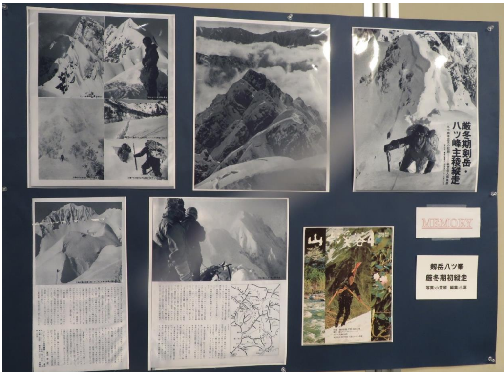
厳冬期初登攀の剣岳八つ峰の登攀記録