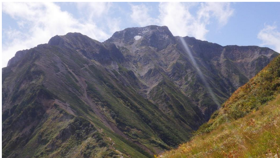
【迫力のある五竜岳】