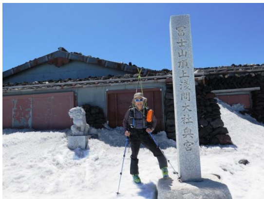
頂上の浅間大社奥宮に到着

剣ヶ峰には行かない事にし、一息入れながら滑走準備をする。剣ヶ峰の写真を撮ってからスキーを履き下山道口から滑り始める。雪の状態は良く快適に滑る。五合目駐車場が真下に見える沢筋の途中まで滑り、下山道