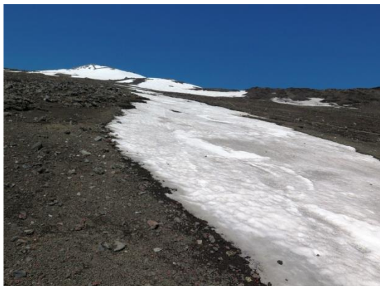
雪渓末端から頂上を仰ぐ