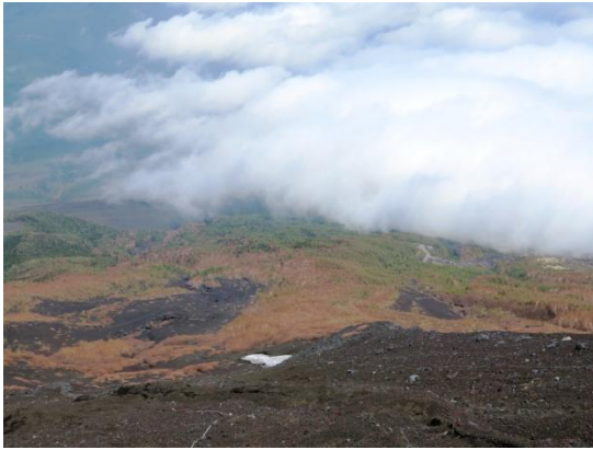
須走口五合目駐車場が見える