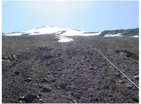
須走口の砂走りから振返る

五合目駐車場に着き、着替えてから帰路に着く。今年も無事に滑り納めが出来た。 コースタイム