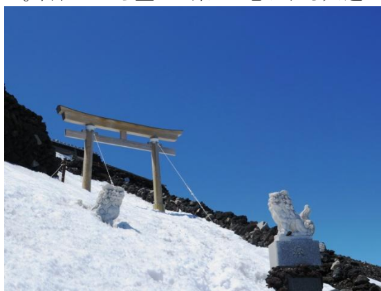
頂上の狛犬と鳥居

頂上の山小屋が間近になり、狛犬と鳥居を抜け、浅間大社奥宮の所に出た。今年も何とか登る事が出来た。群馬から単独で来たと言う女性スキーヤーと話をする。昨日は剣ヶ峰まで登り、今日も吉田口から登って来て吉田大沢を滑ると言う。遅い事。