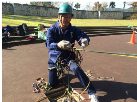
自分をフリーにする。