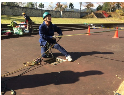
安定した場所に移動する